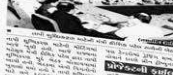
તાપી શુદ્ધિકરણ કાર્યની મર્યાદા કમચોરી કરી અટકી

મુખ્યમંત્રીના ડેવલપિંગ ડાયરેક્ટર તાપી નદીમાં ડેજિંગ શબ્દ વાપરવામાં આવતા વિવિધ સંસ્થાઓને કારણે ગોડાઉનની મર્યાદા કમચોરી કરી અટકી.