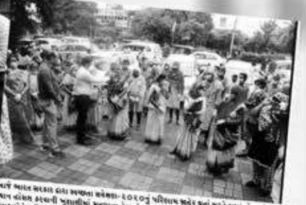
सुरत शहर में आयुष्य विभाग के अधिकारियों ने सफाई कर्मियों को प्रोत्साहित किया।