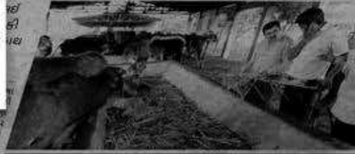
દામતાથી વધુ પશુઓ કરવણ પાંચરાપોળ શિફ્ટ કરાશે: ડે.મેયર

ડે.મેયરે સરપ્રાઈઝ વિઝીટ લઈ મચ્છરોનો હિપદ્રવ તેમજ ગંદકી દેખાતાં વહીવટીતંત્રને આડે હાથ લઈ યોગ્ય વ્યવસ્થા જાળવવા તાકીદ કરી