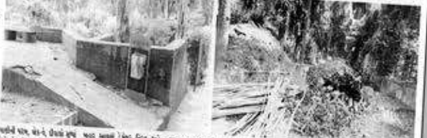
50 50 ખરાબી હતી ?

ડે.મેયર દ્વારા મુલાકાત લેવામાં આવતા આખો બગીચો વૂટેલી હાલતમાં મળ્યો