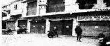
ડુંભાલ ટ્રાન્સપોર્ટ ગોડાઉન પર ફરી મનપાની તવાઈ : ૩૦ સીલ

ડુંભાલ ગોડાઉનને કારણે લેનારા સીડ પર ભારે ટ્રાફિક સમસ્યા સર્જાય છે. ગોડાઉનને ૩૫ માર્ચ ૨૦૧૬ સુધીમાં શહેરની બહાર સિક્કર કરવાની તાકીદ કરાયેલી હતી.