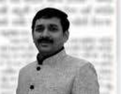
કેડલ ટાઈપ ડસ્ટબિન ખરીદીમાં મોટું કૌભાંડ, સક્ષમ સત્તાની મંજૂરી વિના વર્ક ઓર્ડર અપાયા