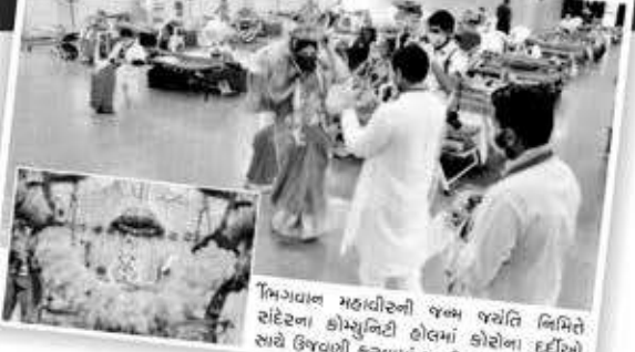
ભગવાન મહાવીરની જન્મ જયંતિ નિમિત્તે સંપ્રતિ કોવિડ આઈસોલેશન સેન્ટરમાં કોરોના દર્દીઓ સાથે ઉજવણી કરવામાં આવી હતી.