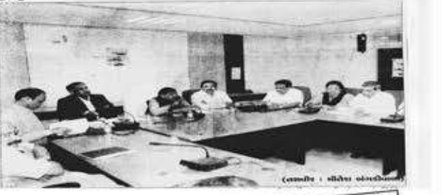
ઘભકાર : મેલચી તાપી શુદ્ધિકરણની કામગીરી કરાશે

મહેસુલ મંત્રી કૌશિક પટેલની લેટસ્ટ ટ્રાન્સપેરન્સી ડાયરેક્ટર તાપી નદીમાં ડેજિંગ શબ્દ વાપરવામાં આવતા વિવિધ સંસ્થાઓને કારણે ગોડાઉનની મર્યાદા કમચોરી કરી અટકી.